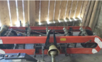
REFORM 2.10 • 3-REIHIG Bandrechen mit Gelenkwelle EUR 1.200