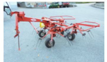
KUHN GF 4000 M • Kreisler mit Ge- lenkwelle EUR 1.800