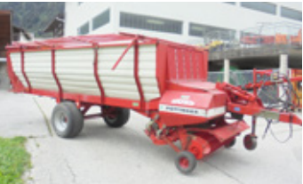
PÖTTINGER BOSS II • Ladewagen mit WWGW EUR 5.900