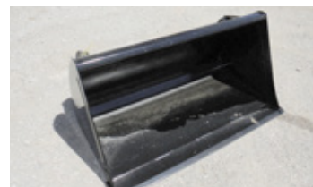
HAUER Schaufel 1.40m • zu Frontlader Hauer-Aufnahme EUR 690 Art. Nr. 5890715

*Alle Preise inkl. MWST bzw. in Vermittlung. Zwischenverkauf, Irrtümer, Satz- und Druckfehler vorbehalten.