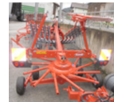
KUHN GA 4431 • Schwader Stützrad, Warntafeln, Beleuchtung, hydr. Umstellung Bügel und Schwadformer EUR 8.450,00 Art. Nr. 5891742