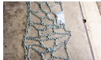
PEWAG UNIVERSAL 452/55-17 • Schneeketten EUR 770 Art. Nr. 586957