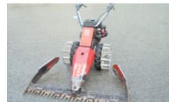
REFORM RM 206 • Motormäher Balken 1.45, unrepariert EUR 1.700