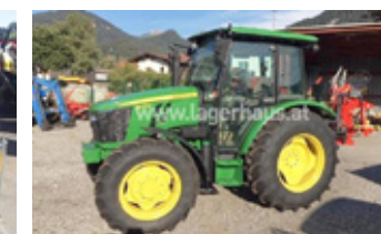
JD 5075E • 12/12 Powr Reverser, 35 km/h, Klima, Luftsitz, 2 dw hinten EUR 42.900,- Art. Nr. 5866749