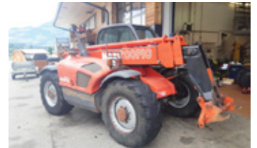
MANITOU MT 932 B-E2 • Teleskoplader BJ 2003 5300 Bstd., in Aufbereitung Preis auf Anfrage