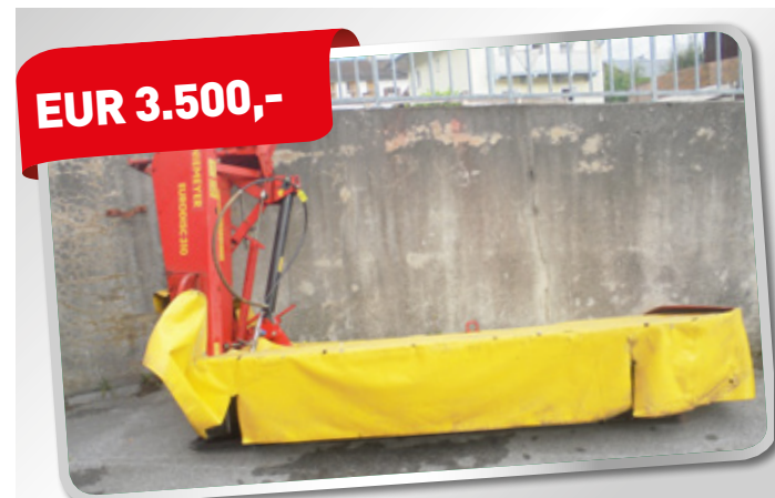
NIEMAYR EURODISC 310 Mähwerk mit Gelenkwelle