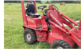
WEIDEMANN 911 D/R • Hoflader EUR 8.500