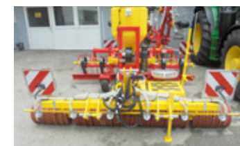
APV GK 300 Grünlandkombi • BJ Vorführmaschine EUR 14.500,00 Art. Nr. 5891820

Für weitere Vorführ- und Ausstellungsmaschinen fragen Sie Ihren Gebietsverkäufer oder unseren Martin Gruber unter Tel. 0664/28 20 799.