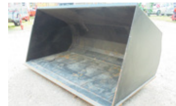
LIEBHERR 4.50 M3 • Leichtgutschaufel neuwertig, Aufnahme für Liebherr/Cat/ Volvo EUR 3.250 Art. Nr. 5869094