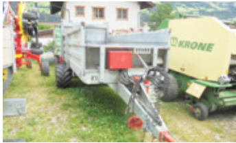
GRUBER SM 650 • Streuer DLA 2-Leiter EUR 17.500 Art. Nr. 5869426