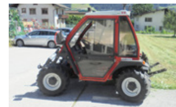
REFORM METRAC G6 Z • weichsmäher BJ 2005 1620 Bstd. EUR 39.500 Art. Nr. 5866413