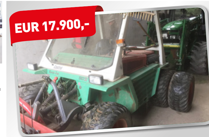
Rasant 1903 SD HHY, Zwilling hinten Art. Nr. 5866694