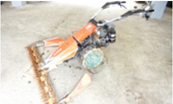
REFORM RM 216 S ROTAX • Motormäher Balken 1.60 EUR 4.500