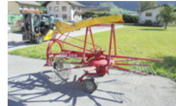
POETTINGER TOP 33 U • Schwader mit Tastrad, Gelenkwelle EUR 1.550