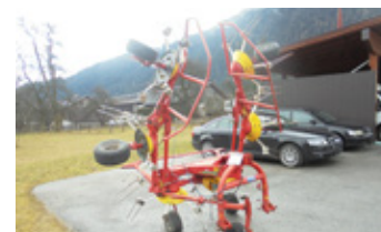
POETTINGER HIT 61 N • Kreisler BJ 2004 mit Tastrad, Gelenkwelle EUR 4.990