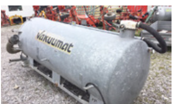
VAKUUMAT AUFBAUFASS • Aufbaufass zu Muli mit kurzem Radstand EUR 1.800