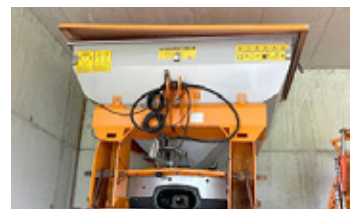
LANDGUT 844 • Streuer BJ 2016 hydr. Schieber, Abdeckhaube, guter Zustand EUR 3.700 Art. Nr. 5867010