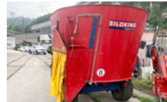
Mayr Compact 10 • Futtermischwagen, mit Gelenkwelle EUR 10.500,-