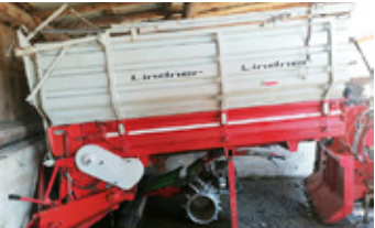
GRUBER Aufbau-Ladewagen • war auf Lindner Uni 65 montiert, Stützen, GW EUR 2.950