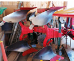
VOGEL&NOOT 950 2-SCHAR • Pflug Scheibensech, Vorschäler EUR 3.700