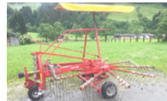
POETTINGER TOP 340 N • Schwader mit Tastrad, Gelenkwelle EUR 1.700