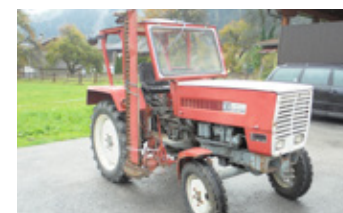
STEYR 30+ • Traktor BJ 1968 unrepariert EUR 2.900 Art. Nr. 5855348