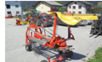
FELLA TS 300 DN • Schwader mit Gelenkwelle EUR 2.650 Art. Nr. 5866408