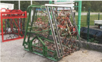
Wiesenegge 6 m EUR 1.100