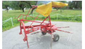
POETTINGER TOP 28 • Schwader mit Gelenkwelle EUR 1.950 Art. Nr. 5884963