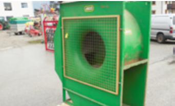
ASCO ASCO 5.5 KW • Lüfter EUR 1.550