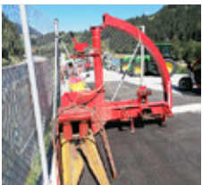
POETTINGER MEX II S • Maishäcksler mit Gelenkwelle EUR 950