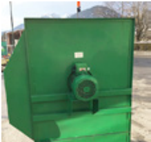
ASCO 5.5 KW • Lüfter EUR 1.300