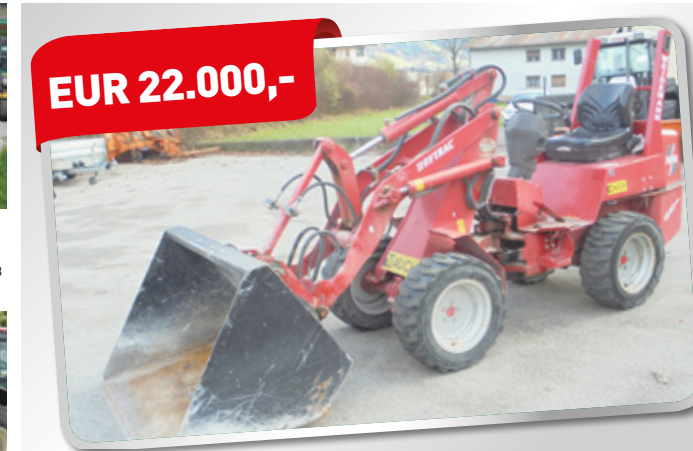
WEIDEMANN 1240 Hoflader BJ 2003 1200 Bstd. mit Schaufel, Ketten Art. Nr. 5853868