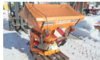
RAUCH 601 • Salzstreuer BJ 2006 Ab- deckplane, Steuermodul, unrepariert EUR 2.450 Art. Nr. 5890788