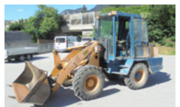
HANOMAG 10 F • Radlader BJ 1995 8643 Bstd. Schaufel, Palettengabel EUR 8.900 Art. Nr. 5866557