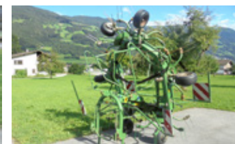
KRONE 6.70 • Kreisler mit Gelenkwelle EUR 3.900