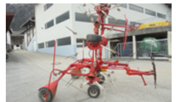
POETTINGER HIT 80 A • Kreisler mit Gelenkwelle EUR 3.980