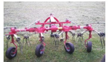
DAROS GREEN 4 GS • Kreisler BJ 2015 mit Gelenkwelle EUR 2.200