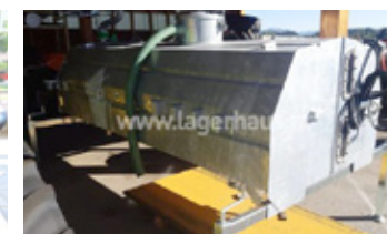
KURATLI 2600 • Güllefass zu Muli mit Radstand lang, Front- und Heckentleerung EUR 14.200,00 Art. Nr. 5866591