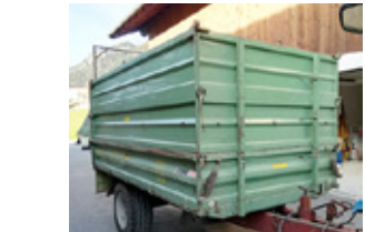
BRANTNER E 3S 3500/1900/5 • Dreiseitenkipper BJ 1984 Plateau 3500 x 1900, hohe Stahlbordwände, Bereifung neu EUR 4.700 Art. Nr. 5868689