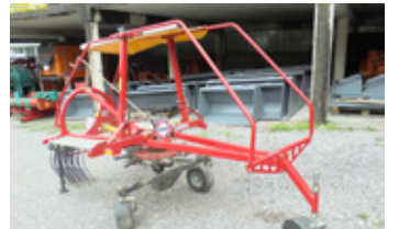
FELLA TS 301 • Schwader BJ 2011 mit Gelenkwelle EUR 4.700 Art. Nr. 5849918