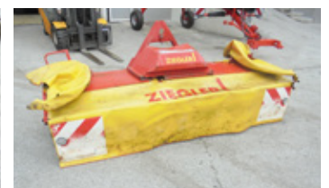
ZIEGLER 3 M • Mähwerk zu Carraro EUR 1.390