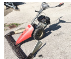
AEBI AM 9 • Motormäher Balken 1.40, Subaru Robin EX 27 EUR 2.600