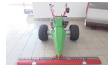
RAPID MONTA 14 PS • Mäher BJ 2017 Balken 1.90 FS, Gummiräder EUR 14.990,00 Art. Nr. 5889154