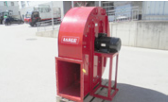
LASCO LA 800/6 4 KW • Lüfter rechts saugend EUR 4.000