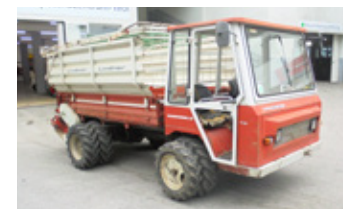
LINDNER T 3500 • Transporter BJ 1987 5200 Bstd. Ladewagen, Geba Hochdruck- fass, Zwilling v. und hi. EUR 16.500 Art. Nr. 5866177