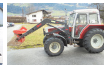
STEYR 955 A • Traktor BJ 1994 6800 Bstd. Hauer MH 80 Frontlader, 2 Arbeits- geräte EUR 23.200 Art. Nr. 5869514