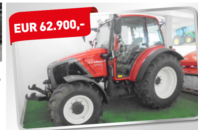
LINDNER GEO 84 EP Vorführer Traktor BJ 2018 Art. Nr. 5889736