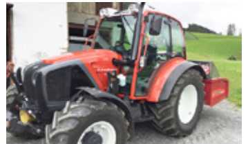
LINDNER GEO 74 EP • Traktor BJ 2017 500 Bstd. EHR, 4 x dw, Hauer TBS Konsole EUR 57.900 Art. Nr. 5867007