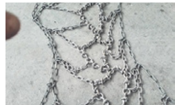
480/70-30 Netz verstärkt • Schneeketten EUR 1.900 Art. Nr. 5890343