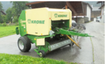
KRONE 1250 MC • Ballenpresse BJ 2001 6900 Ballen, WWGW, ohne Bremse EUR 17.300