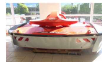
KUHN GMD 3123 • F-FF Mähwerk BJ 2020 hydr. Klappung EUR 11.550,00 Art. Nr. 5866390