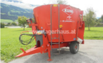
KUHN EUROMIX 870 • Mischwagen BJ 2003 2. Schieber EUR 9.900