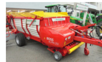
POETTINGER BOSS ALPIN 251 • Ladewagen hydr. Bremse, Select Control, EUR 26.900,00 Art. Nr. 5891853