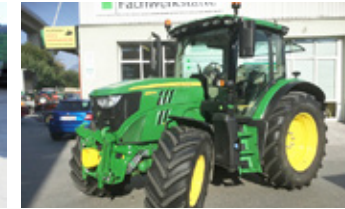
JOHN DEERE 6130R • Traktor BJ 2019 400 Bstd. EUR 124.900 Art. Nr. 5866187