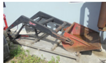
HAUER MH 80 • Frontlader Schaufel 1 m, elektrische Ausklinkung EUR 700 Art. Nr. 5866752