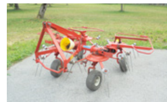
KUHN GF 440 SRP • Kreisler BJ 1993 mit Gelenkwelle EUR 1.450