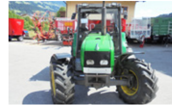
JOHN DEERE 3200 A • Traktor BJ 1995 7530 Bstd. 1 x ew, 1 x dw, Zwilling hinten EUR 18.900 Art. Nr. 5823968

REFORM. Teamwork Technology. www.reform.at