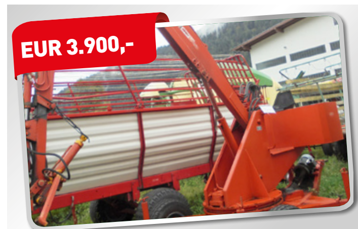
BENNY Heckbagger Zapfwellen und Elektro-Antrieb Art. Nr. 5821954