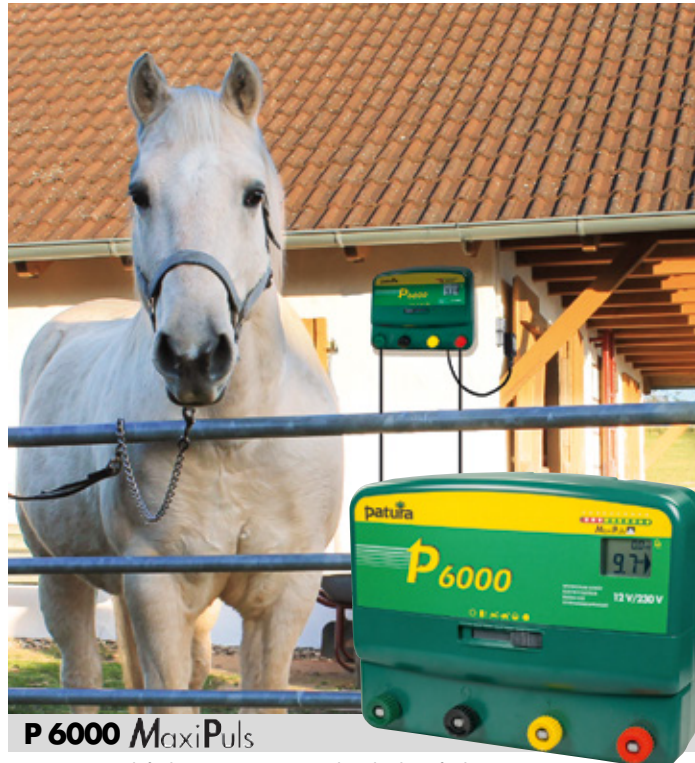
P 6000 MaxiPuls

Das PATURA Multifunktions-Gerät mit MaxiPuls-Technologie für lange Zäune mit stärkerem Bewuchs für Rinder, Schafe, Pferde und Wildabwehr; 10-stufige Zaun- und Batteriekontrolle, 6-Stufenschalter, Tiefentladeschutz; Digitalanzeige zur Zaun-, Erdungs- und Batteriekontrolle; Erdungskontrolle über Referenzterde; inkl. 230 V Netzteil, 12 V Edelstahl-Anschlusskabel und Zaun-/Erdkabelset, Ladeenergie: 20,0 Joule