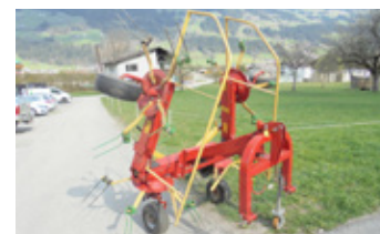
GALFREI 4.50 M • Kreisler 3-Punkt-An- bau, Schwenkbock EUR 1.980