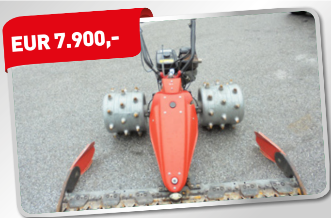
REFORM RM 7 Motormäher BJ 2012 Balken 1.60 Art. Nr. 5824421