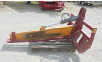
SOMA Dreipunkt • Ballenschneider EUR 900