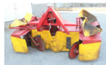
POETTINGER EUROCAT 270 • Mähwerk mit Gelenkwelle EUR 950