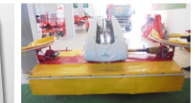
POETTINGER NOVACAT 301 AM MASTER • Mähwerk BJ 2019 EUR 13.500,00 Art. Nr. 5856875