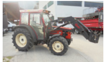
SAME ARGON 60 • Traktor BJ 1995 3000 Bstd. Frontlader mit Schaufel, Ketten vorne und hinten EUR 21.900 Art. Nr. 5868643