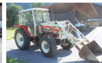
STEYR 8070 A • Traktor BJ 1986 6654 Bstd. Hauer Frontlader mech. EUR 17.900 Art. Nr. 5866420