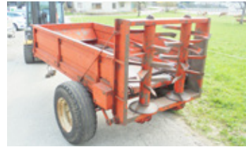
BEVILAQUA Bergstreuer • 2 stehende Walzen, ca. 2 To Nutzlast, Gelenkwelle EUR 1.980 Art. Nr. 5866120