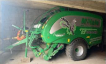
MC HALE FUSION 3 PLUS • Wickelkombi BJ 2016 13500 Ballen EUR 67.500