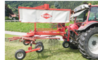
KUHN GA 4121 TANDEM • Schwader mit Tastrad, Gelenkwelle EUR 4.650 Art. Nr. 5866621