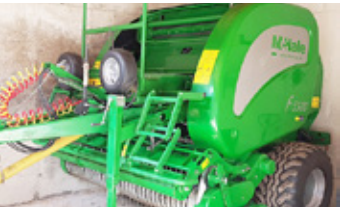
MC HALE F 5500 • Ballenpresse BJ 2015 9800 Ballen, Messergruppenschaltung, DLA EUR 28.900