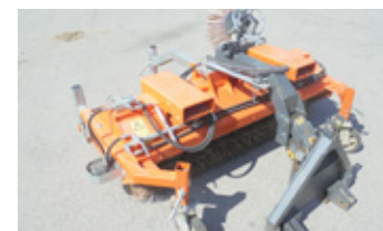
TALEX 150 CM • Kehrmaschine BJ 2015 EUR 3.300 Art. Nr. 5869170