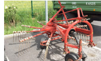
POETTINGER TOP 33 U • Schwader mit Gelenkwelle EUR 1.850