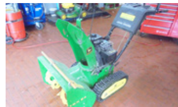
JOHN DEERE TRX 24 • Schneefräse mit Raupenantrieb, unrepariert EUR 690 Art. Nr. 5855403