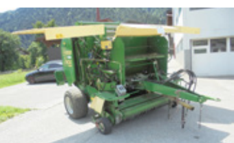
KRONE VARIO PACK 1500 • Ballenpresse 11300 Ballen, hydr. Bremse EUR 15.900