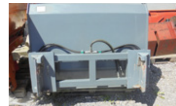
HEVI Hochkippschaufel • zu Frontlader Hauer-Aufnahme, Ausstellungsma- schine EUR 1.650 Art. Nr. 5868790

*Alle Preise inkl. MWST bzw. in Vermittlung. Zwischenverkauf, Irrtümer, Satz- und Druckfehler vorbehalten.