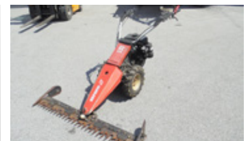
REFORM RM 206 Motormäher Balken 1.45 EUR 4.500