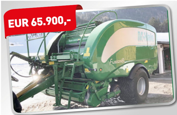
MC HALE FUSION 3 Wickelkombi BJ 2015 5550 Ballen, DLA, 25 Messer, Gruppenschaltung, Rollen-Niederhalter Art. Nr. 5890807