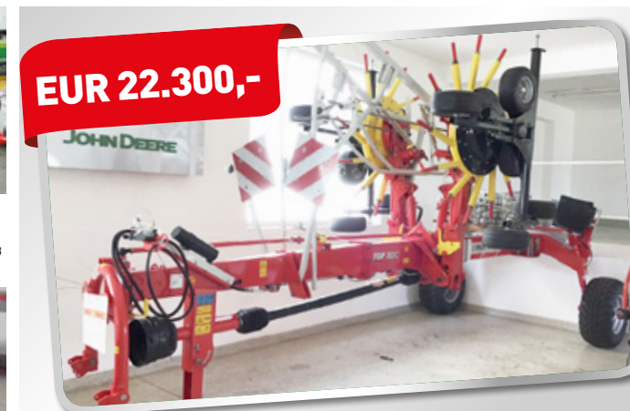
Pöttinger Top 762 C 340/55-16, Tasträder für Mittenschwadd Art. Nr. 5868897