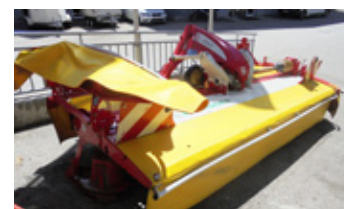
POETTINGER NOVACAT 351 CLASSIC • Mähwerk BJ 2015 mit Gelenkwelle EUR 8.990