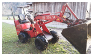
THALER 226 KL • Hoflader BJ 2009 950 Bstd. mit Schaufel, Ballenspiess, Ketten EUR 19.500 Art. Nr. 5866088

*Alle Preise inkl. MWST bzw. in Vermittlung. Zwischenverkauf, Irrtümer, Satz- und Druckfehler vorbehalten.