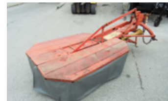
FAHR KM 22 • Mähwerk mit Gelenkwelle EUR 690