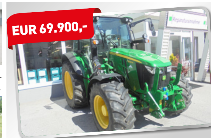
JOHN DEERE 5090 R Traktor BJ 2017 992 Bstd. 3 mech. Stg., mech. Federung, FL-Vorbereitung Art. Nr. 5823485