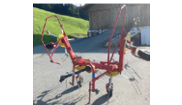
POETTINGER HIT 44 H • Kreisler BJ 2010 mit Gelenkwelle EUR 2.600