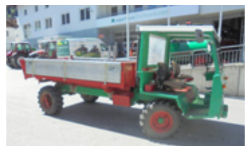
SCHILTER T 3500 • Transporter BJ 1984 3 Seitenkipper, hydr. Rückwand bei Brücke EUR 11.500 Art. Nr. 5866573