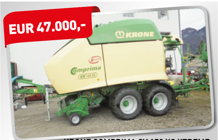
KRONE COMPRIMA CV 150 XC XTREME Wickelkombi BJ 2015 8600 Ballen, Folienbindung, Rollboden hinten ca. 1000 Ballen, 26 Messer, Gruppenschaltung Art. Nr. 5890794