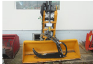
Big Lift 3-Punkt Lader • Palettengabel mit Niederhalter, 2 Schaufel r EUR 4.980 Art. Nr. 5848334