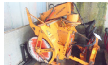
KAHLBACHER KFS 650/1440 • Frässhleuder EUR 4.900 Art. Nr. 5869505