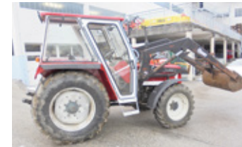
LINDNER 1500 A • Traktor BJ 1987 5270 Bstd. Hauer Frontlader mech., neu bereift EUR 15.900 Art. Nr. 5869343