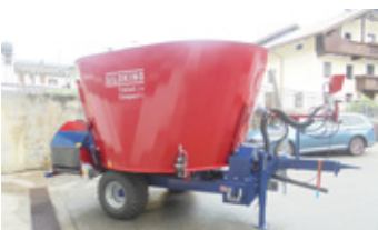
MAYER CLASSIC COMPACT 10-T • Mischwagen BJ 2019 Vorführmaschine EUR 25.900