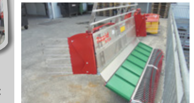
RAPID MULTI TWISTER 220 • Mäher Vorführer, passend zu Rapid EUR 11.490,00 Art. Nr. 5867702