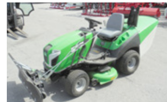
VIKING T6 • Rasentraktor BJ 2015 mit Schneeschild, Mähwerk, Grasfangkorb EUR 3.900