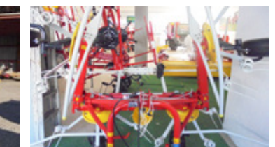
POETTINGER ALPINHIT 4.4 H • Kreisler BJ 2019 hydr Aushebung EUR 6.450,00 Art. Nr. 5855029