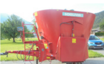
Schriyver Mischwagen 10 • mit Gelenkwelle EUR 6.300