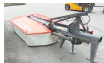
PZ PZ 190 Mähwerk mit Gelenkwelle EUR 3.500