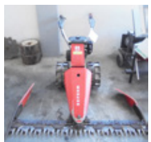
REFORM RM 216 S • Motormäher Balken 1.60 EUR 2.250