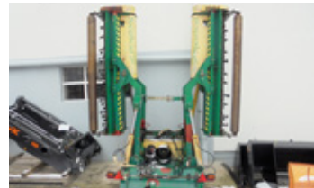
SPEARHEAD 5000 • Mulcher EUR 1.850 Art. Nr. 5869516