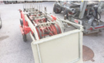
AEBI 2.30 3-REIHIG • Bandrechen zu Aebi 1000 upm, sehr guter Zustand EUR 2.700