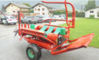
KVERNELAND UNIWRAP 7512 • Wickelmaschine 500er Folie EUR 3.100