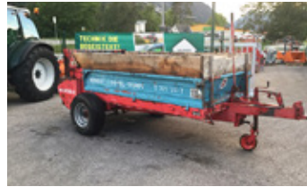
MENGELE DOPPEL TRUMP S 320 • Streuer EUR 2.400 Art. Nr. 5866514