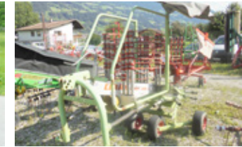
CLAAS CLASS 390 S TANDEM • Schwader mit Gelenkwelle EUR 2.900 Art. Nr. 5890875