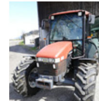
NEW HOLLAND TN 75 D • Traktor BJ 1999 4000 Bstd. 2 x dw EUR 23.900 Art. Nr. 5822507