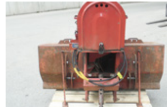
IGLAND IGLAND PRIMAX • Seilwinde mit Gelenkwelle EUR 1.100 Art. Nr. 5866204