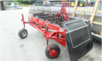
MOLON 230/5 PRO • Bandrechen Pendelbock, Weiste-Anbau, doppelte Tasträder EUR 4.600