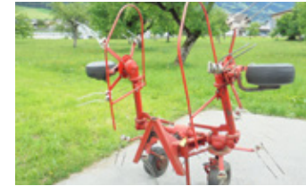
SIP 3500 • Kreisler mit Gelenkwelle EUR 1.550 Art. Nr. 5822561

Mehr erfahren Sie unter: www.vitli-krpan.com/de