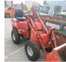
WEIDEMANN 1120 HYDROSTAT • Hoflader BJ 2002 2300 Bstd. mit Schaufel EUR 15.900