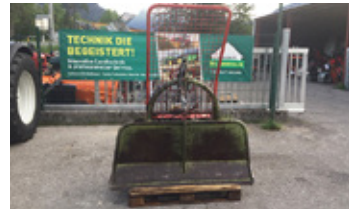
HOLZKNECHT HS 304 • Seilwinde EUR 1.400 Art. Nr. 5866515